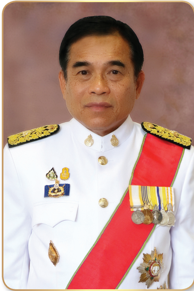
นโยบายประธานศาลฎีกา นายไสลเกษ วัฒนพันธุ์